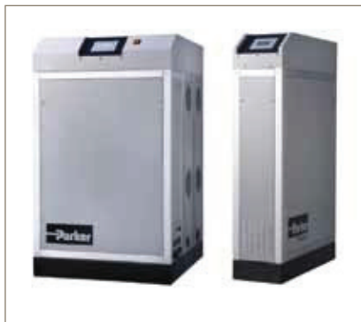
Membran- Stickstoffgeneratoren NitroFlow