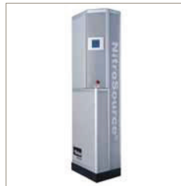
Membran-Stickstoffgeneratoren NitroSource HiFluxx

Zusätzliche Produkte, die für eine vollständige Stickstofflösung in Lebensmittelqualität verfügbar sind: