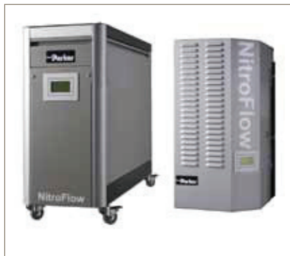
Membran- Stickstoffgeneratoren NitroFlow Basic

Bitte wenden Sie sich an Ihren Ansprechpartner von Parker vor Ort, um die Lösung zu finden, die genau Ihren Anforderungen entspricht.